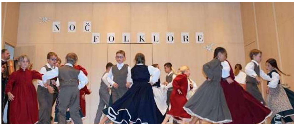
(Besedilo: Simona Napast)

Vsi pa smo predvsem uživali v čudovitih plesih in koreografijah, ki jih je za svoje folklornike pripravila mentorica Maša Stres. Vsi si zaslužijo en velik aplavz in posebno pohvalo za dovršene nastope.