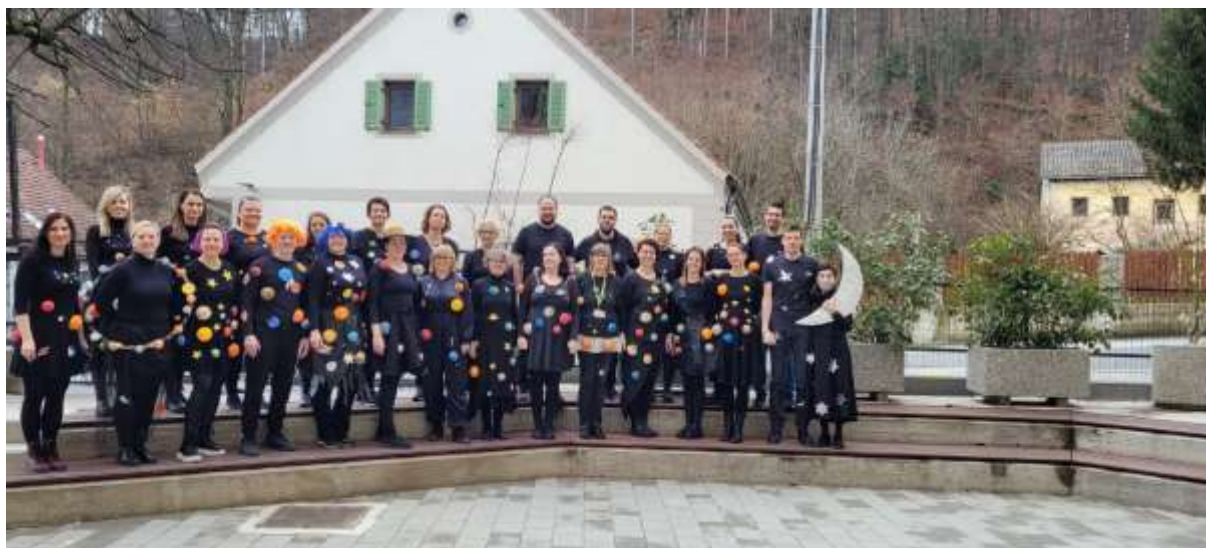
(Besedilo: Simona Napast)