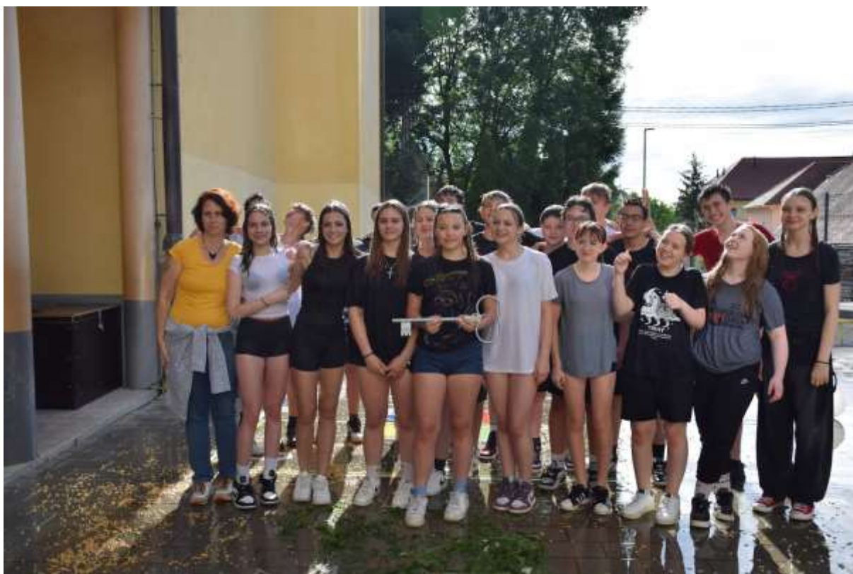
(Besedilo: Simona Napast)

Po soglasno odrecitirani zaprisegi, da bodo vzorni in spoštljivi učenci, katerih največja vrednota bo učenje in delanje domačih nalog (hec 😊), in obilici vode iz veder in cevi, ki jih je dodobra zalila, so zmagovalci začeli razmišljati o vseh vratih, ki jih bo še potrebno odkleniti, preden bodo zapustili osnovnošolske klopi.