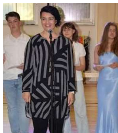
(Besedilo: Simona Napast)