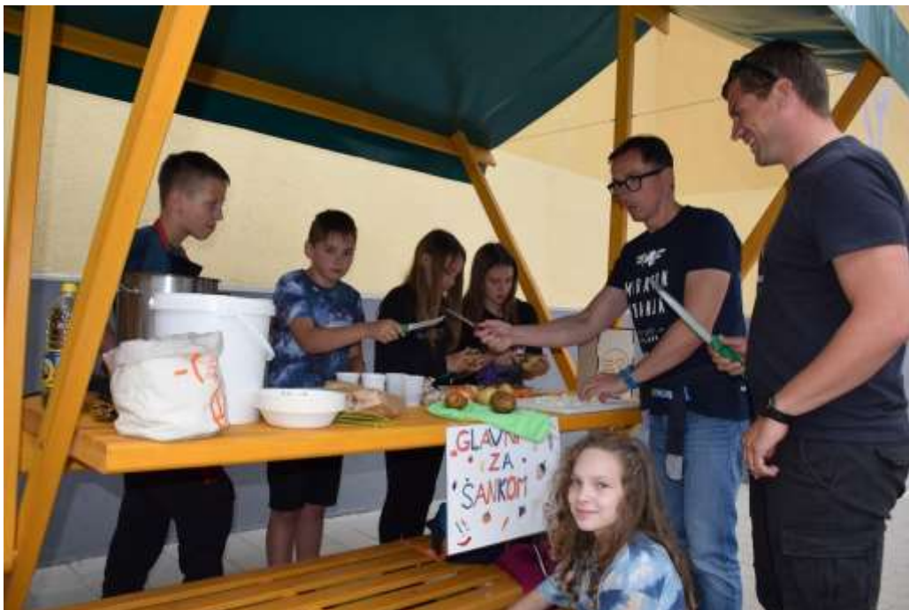
Glavni za šankom