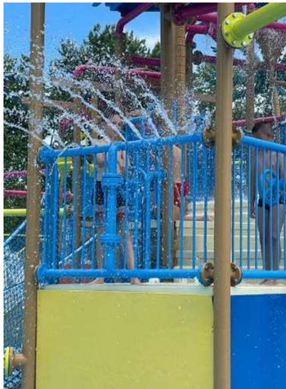
(Besedilo in fotografiji: Maša Stres)