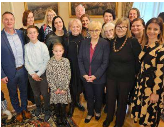
Skupinska fotografija s predsednico države, Natašo Pirc Musar.

Naša skupina je bila, milo rečeno, deležna izjemne pozornosti, saj smo bili že isti dan na domala vseh televizijskih poročilih, intervjuvanci pa so svojo nalogo več kot odlično opravili.