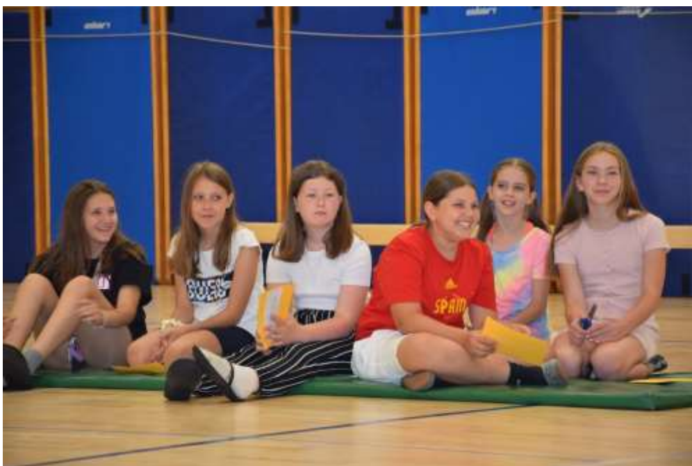
(Besedilo: Simona Napast)

Naj bodo počitnice, ki so pred vrati, čas, ko nas letni čas zvabi v svoj objem, sončni žarki pa naj naš svet obsijejo z veliko močjo.