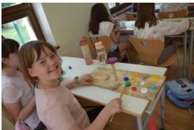
(Besedilo: Simona Napast)