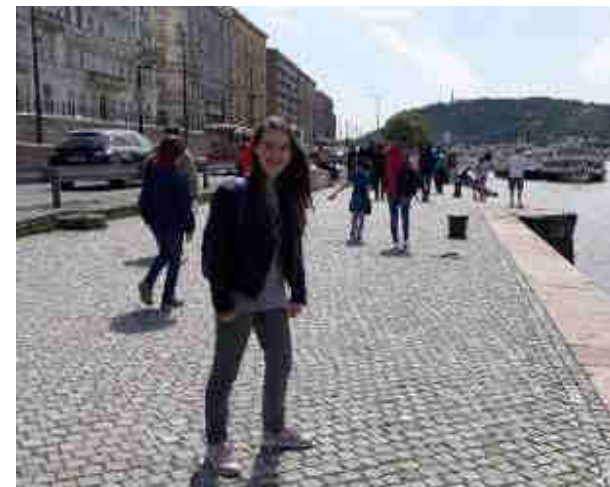
Slovenski tekmovalci in njihovi spremljevalci